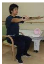
背すじを伸ばして棒を持つ