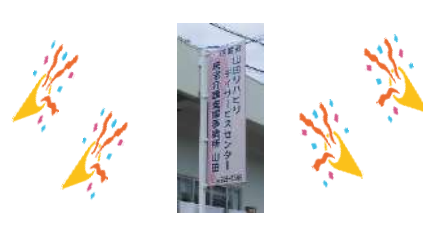
ピンクになりました(#.^.#)