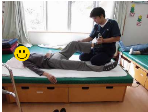
理学療法士による下肢の運動です！ バランスを強化して安全な生活を！！