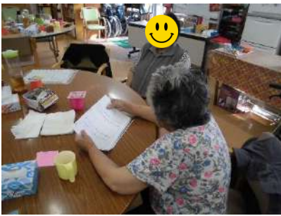
1人が計算問題を出し、1人が答える。 新しい認知訓練スタイルですね☆