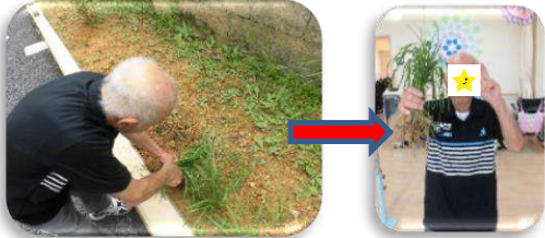
庭のソベ農園でニラの収穫！ はいポーズV さすがはベテラン！手慣れています(*^^)v