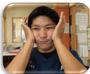
頬に手を当てて顔の筋肉をほぐす(20秒の2セット)