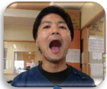
大きく口を開いて「あいうえお」 恥ずかしい方は手で隠してもOK

「食欲の秋」もすぐそこですね！今月は食事を美味しくスムーズに食べられるように、口まわりの自主トレを紹介いたします。口まわりの筋肉をほぐす、つばを出しやすくする、食物を飲みこみやすくする、今これを見ているあなたの！！さあ、下の4つのメニューを実践してみましょう(^^)／