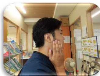
唾液を出すマッサージ (耳の少し前を押さえて回す)