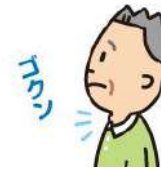
つばを飲み込む 3回程度