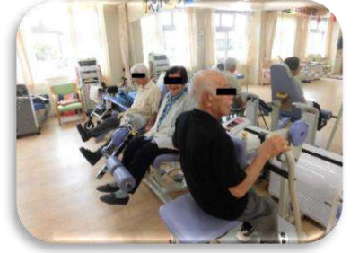
筋トレ機械も大人気♪ 職員も顔負けの筋力です！