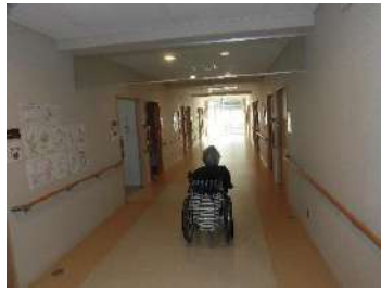
2階の長い廊下を利用して車椅子を漕ぐ練習！いい運動にもなって汗もかくほど♪