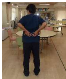
腰を上下にゴシゴシ (スポンの上げ下げ動作)