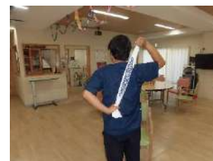
タオルで背中をゴシゴシ～ (入浴動作)