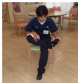
足を組む (靴下を履く動作)