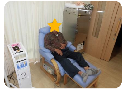
電気治療でリラックス！「この椅子、はいはい学校でも見たよ」らしい。