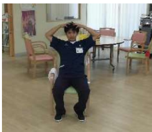
両手で頭のマッサージ (シャンプーをする動作)

「体操は上手だけど、家ではお風呂とか洋服を着るのを手伝ってもらっている」という方は少なくありません。ということで今回は、実際に動きは出来るけど、介護に頼りがちな生活動作の練習を紹介します。リハビリの基本は「自分で出来る事は自分で行ないましょ～♪」です！そこのあなた、まずは動きをマネてみましょ～。